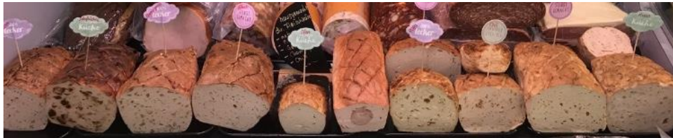
10 Sorten Fleischkäse