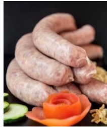
Schweinsbratwürste wie zu „Vatis Zeiten“