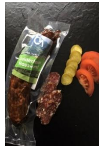
Landjäger, Rohessspeck und Hauswurst nach überliefertem Rezept