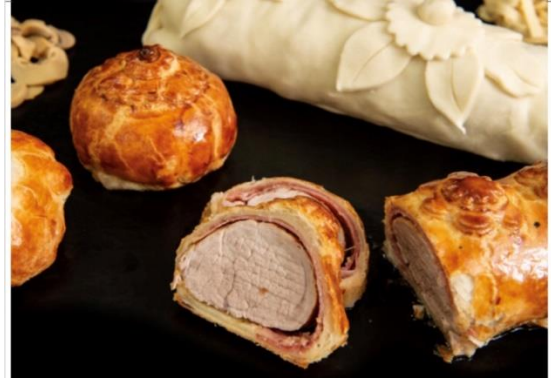
Guldentaler Braten, Filet im Teig und „Muttis" Filetküsseli