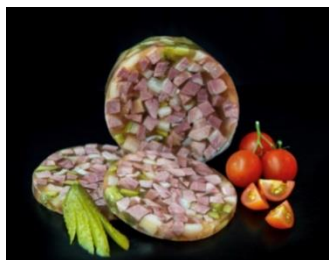
gefüllte Kalbsbrust und Schwartmagen