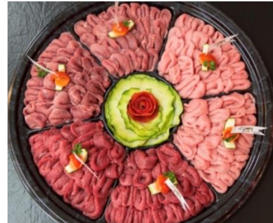
Fondue Chinoise, Tischgrill, Tartarenhut ganz nach Ihren Wünschen zusammengestellt (Tagespreise)